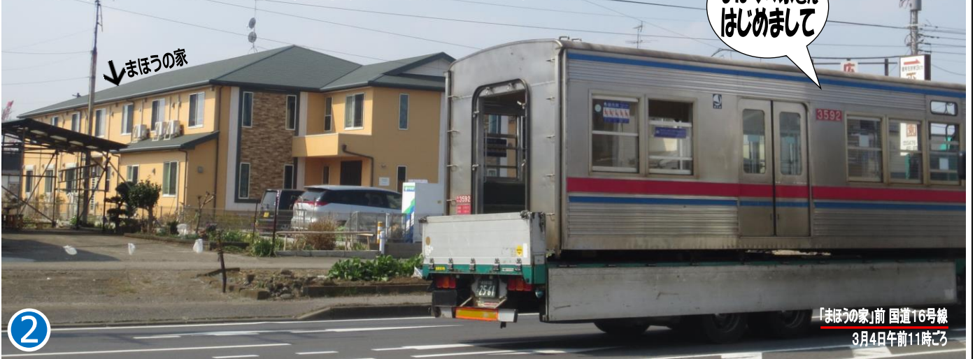
「まほうの家」前 国道16号線 3月4日午前11時ごろ