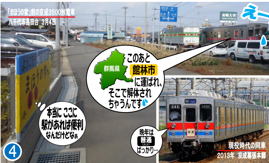
「まほうの家」前の京成3500形電車 八千代市島田台 3月4日

16号線を経由し、群馬県北館林にある解体場へ陸送の際、ここ「島田台」も通るわけです。運よく業務時間内にとらえることができましたのでご紹介いたします。昭和55年製造の3500形電車が「まほうの家」前をあっけなく走り去って行きました。35歳の最期は冷房装置等を取り外し輪切りにされ痛々しい姿ではありましたが、よくがんばりましたね、さようなら!