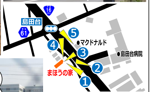
島田台交差点手前 3月3日